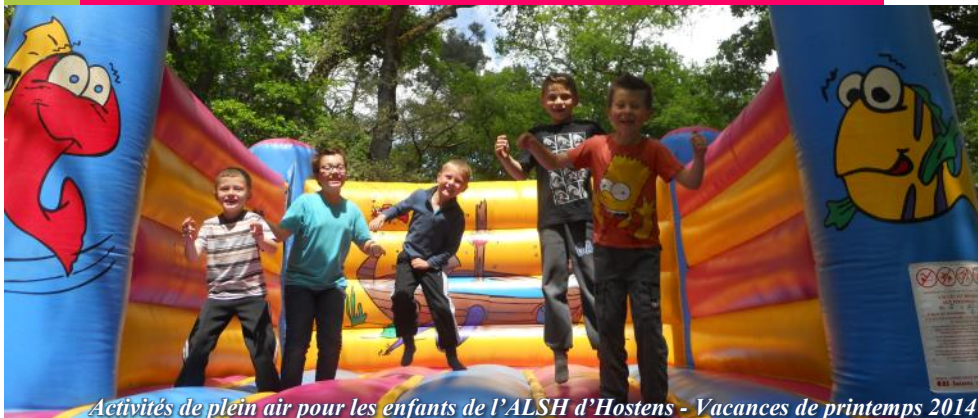
Activités de plein air pour les enfants de l'ALSH d'Hostens - Vacances de printemps 2014

LES ACCUEILS DE LOISIRS FINIS PRETS POUR LES VACANCES : TOUR D'HORIZON DES ACTIVITES DE L'ETE