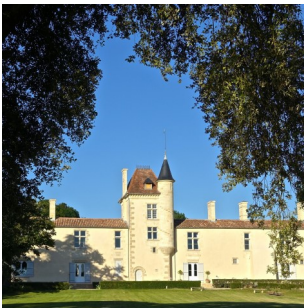
[ Château de Malromé crédit photo Château de Malromé ]

" Difficile de dissocier Saint-André du Bois de son prestigieux Château Malromé qui fut la demeure familiale de Toulouse-Lautrec.