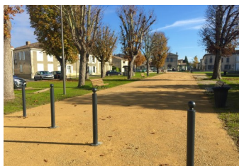
[ Place centrale rénovée dans le cadre d'une Convention d'Aménagement de Bourg ]

" Noaillan est un village en plein développement. Par la richesse de ses équipements (agence postale, école de près de 200 enfants, city-stade, salle des jeunes, etc.) et la diversité d'une vingtaine d'associations.