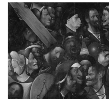
Le portement de croix de Bosch (~1516)