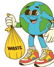
Capture ton déchet