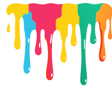
Les peintures magiques Sièste