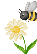
Les fleurs et les abeilles Sièste