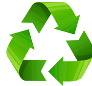
Le toucher du recyclage Sièste