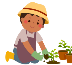
Les jardiniers de demain