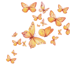
Les papillons du printemps