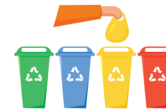
Le relais du tri