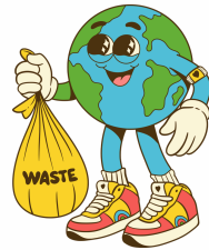
Chasse aux déchets