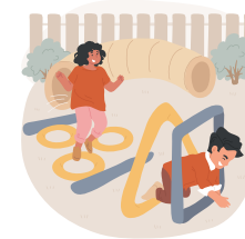
Parcours du combattant