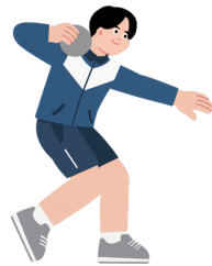
Lancer de poids